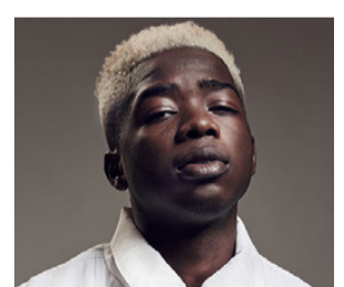
Den franske rapparen MHD har dömts till tolv års fängelse för mord.

MHD, omnämns ofta som en föregångare för musikstilen som kallas Afro Trap - en blandning mellan hiphop och afrikansk musiktradition. Han fick sitt genombrott med låten "Afro Trap Part. 3 (Champions League)", som hyllar fotbollsla-