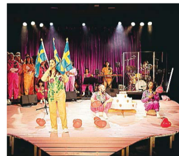
Tal till nationen med Konstgruppen Ful.

Festival Normal arrangeras med stöd av Umeå kommun, Region Västerbotten, Kulturrådet och Dans i Västerbotten.