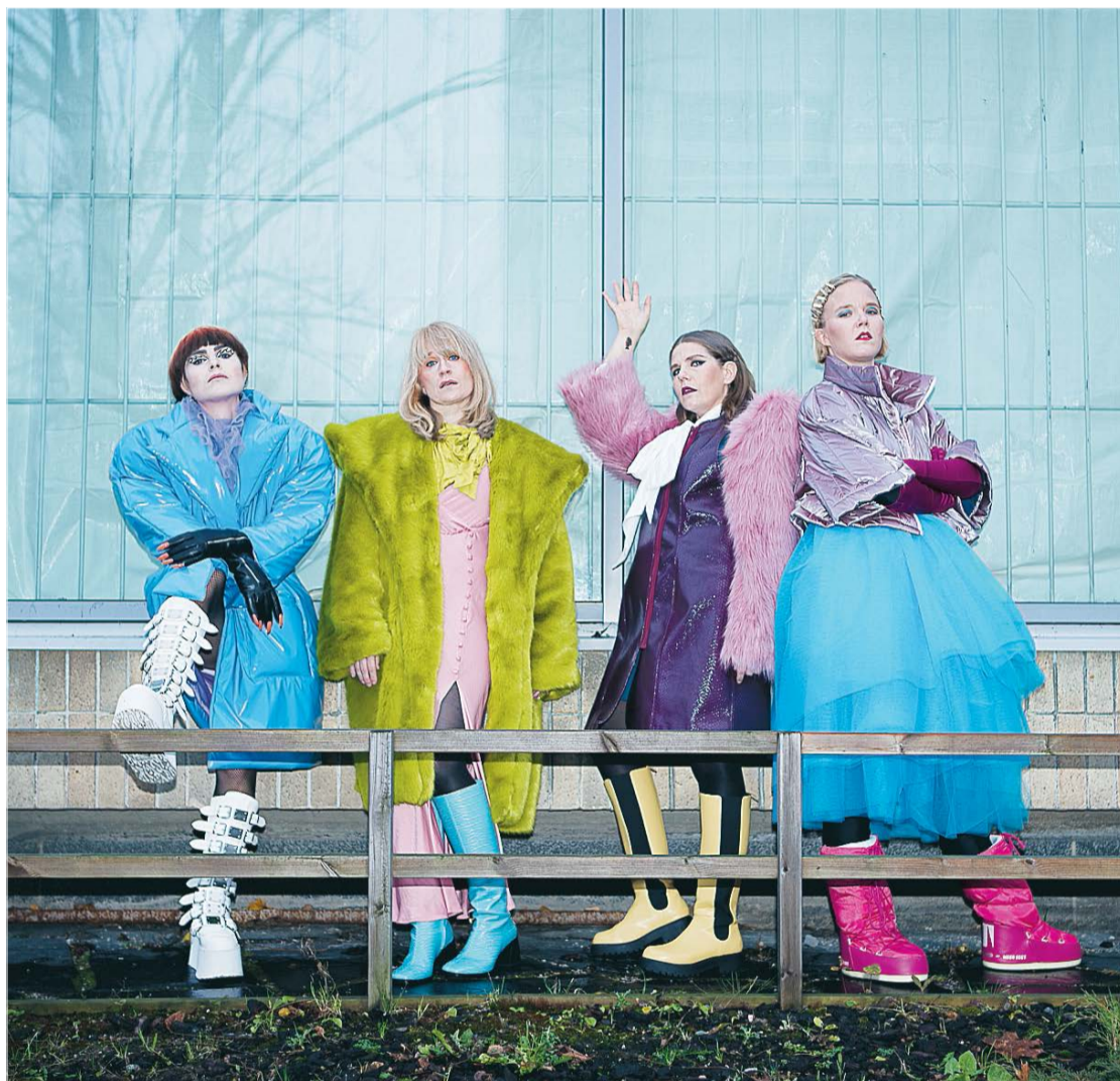
Den finska feministiska teatergruppen Blaue Fraue ger den interaktiva föreställningen Pleaser.