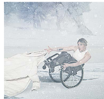
Ur Vinterresa med Skånes Dansteater.