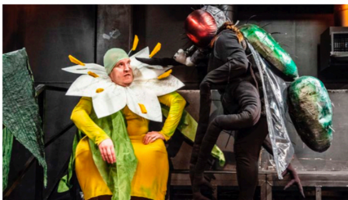
Föreställningen "Vilka är ni?" är skapad av Ihrman och regissören Maja Salomonsson.