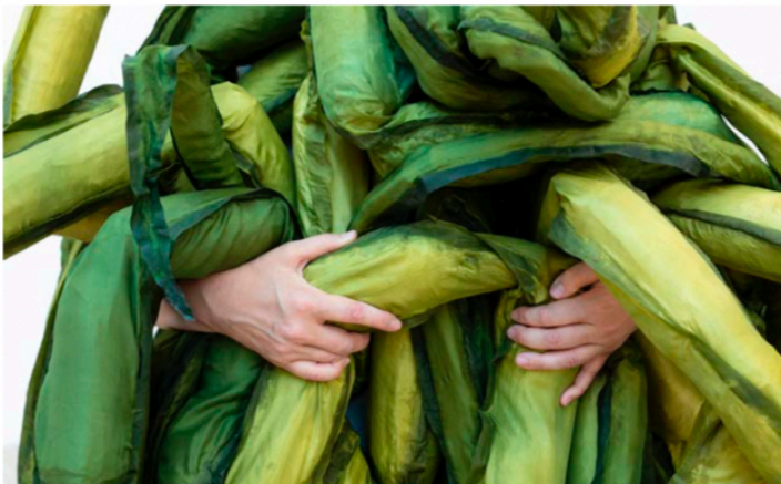
Ingela Ihrman, "Tarmtång", 2019.

"Att bli utskratad när man hoppar ljushopp och dunsar ner i tjockmattan får en helt annan betydelse i padddräkt."